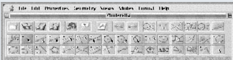
Figura 3. Menu do programa Cinderella .