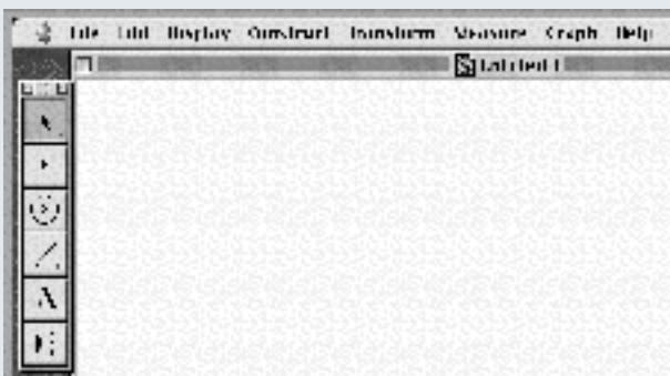
Figura 1. Menu do programa Geometer's Sketchpad .

O Cinderella está escrito em Java , pelo que se pode instalar em qual-